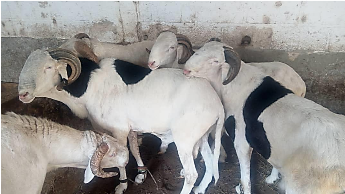
LES 05 MÂLES « GENITEURS » LADOUUM