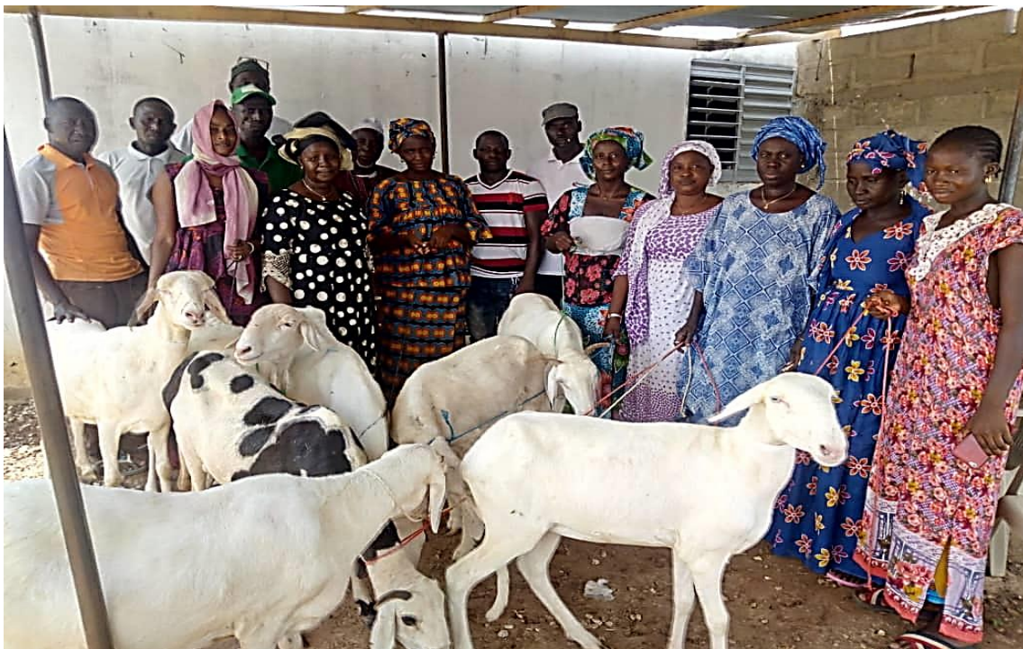
REMISE DES BREBIS COUPLEES AVEC LES GENITEURS AUX FEMMES BENEFICIAIRES DE LA PREMIERE TRANCHE – LE 16 SEPTEMBRE 2019 AU SIEGE DE LA FEPROMAS